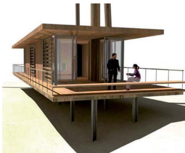
MAISONS SUR PILOTIS (Touraine et Charentes-Maritimes)