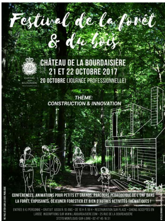
Affiche du Festival 2017

L'intégralité du programme peut être téléchargé sur le site : www.labourdaisiere.com